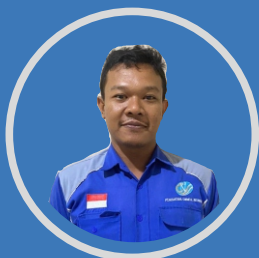
RIZAL MARKETING 0815 1517 1816