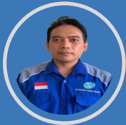
RENDY MARKETING 0853 3647 4155